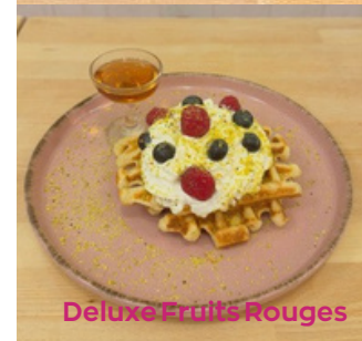
Deluxe Fruits Rouges

Thé vert au jasmin Thé vert aux fruits rouges Thé vert à la menthe Infusion verveine